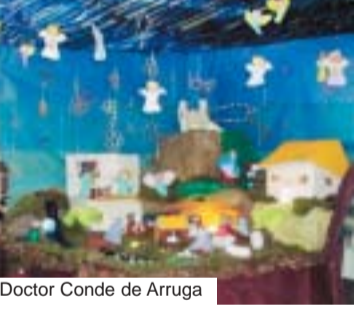
Doctor Conde de Arruga