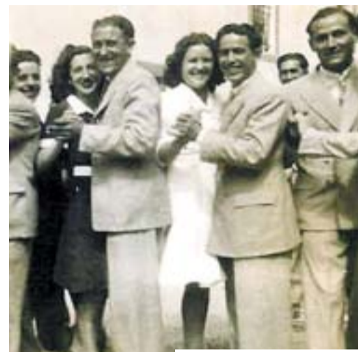
Mozos y mozas bailando

La Nochevieja apenas se celebraba, pero el día de Año Nuevo sí era celebrado de forma importante. Todos los domingos y días de fiesta, excepto en el verano porque se trabajaba todos