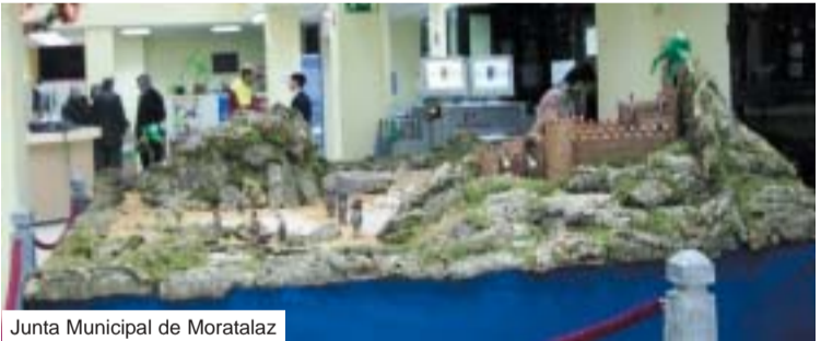
Junta Municipal de Moratalaz