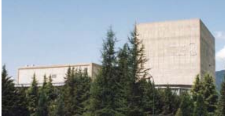
Santa María de Garoña (Burgos)

a más de un Gobierno el cierre definitivo de las centrales. Los principales inconvenientes de estas moles de hormigón son la cantidad de residuos tóxicos y radiactivos que producen y el daño al medio ambiente que producen y el almacenamiento de esos residuos, los conocidos cementerios nucleares que todo el