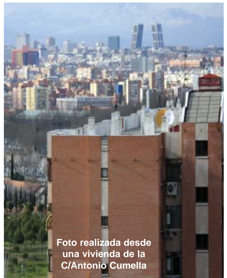
Foto realizada desde una vivienda de la C/Antonio Cumella