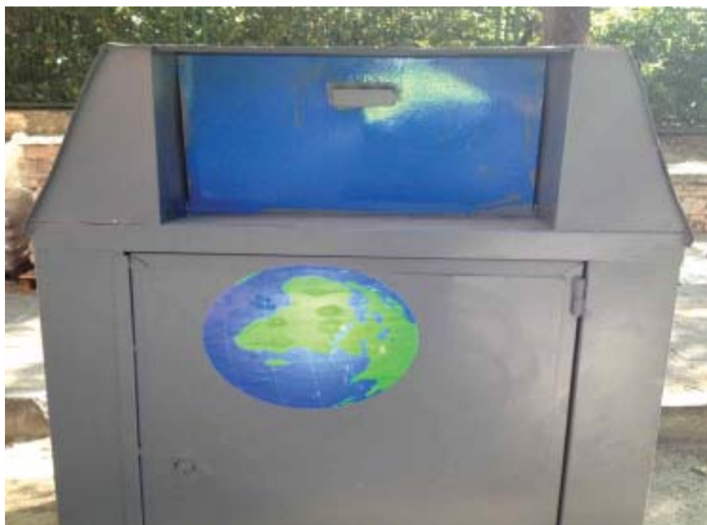
Imagen de uno de los contenedores incautados.

Además se incautaron de cuatro juegos de 10 llaves cada uno, todas ellas numeradas, y de dos libretas donde se especificaba la ubicación de más contenedores, con la numeración coincidente. Eso permitió comprobar la existencia de los mismos en las calles de Arroyo de