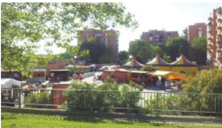
Mercado de la Magia del pasado año en la Plaza Manuel de la Quintana

El Recinto Ferial estará ubicado en la Calle Brujas (detrás del Polideportivo)