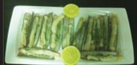
Navajas a la Plancha