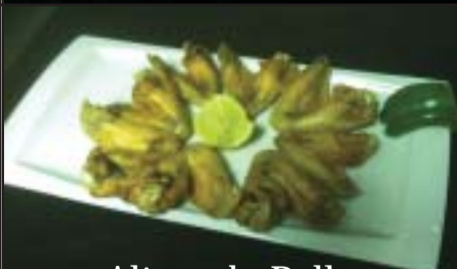
Alitas de Pollo