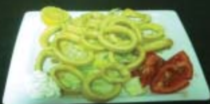
Calamares a la Romana