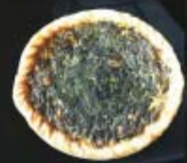
Pastel de Espinaca