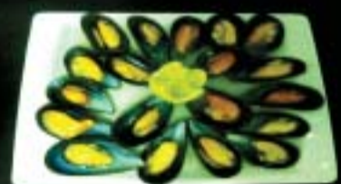
Mejillones al Vapor