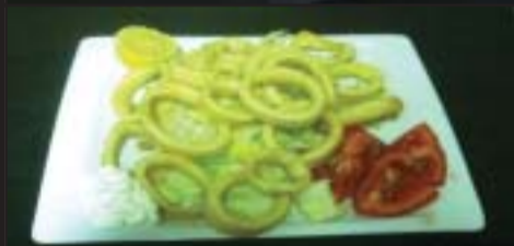
Calamares a la Romana