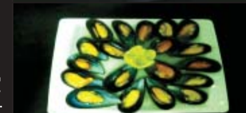
Mejillones al Vapor