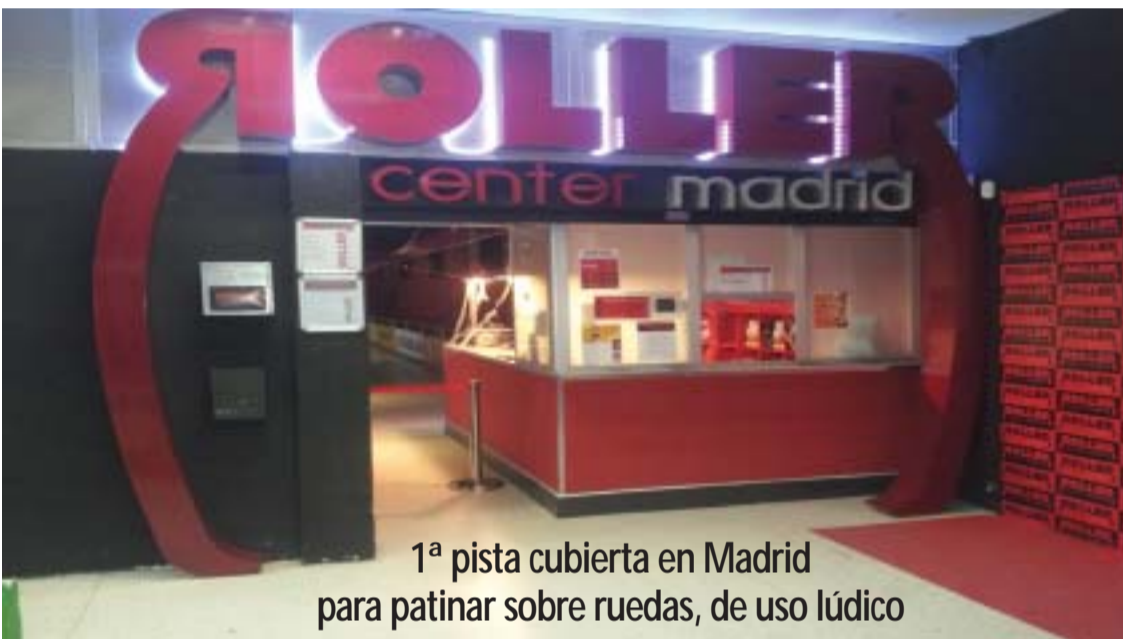
1ª pista cubierta en Madrid para patinar sobre ruedas, de uso lúdico

El pasado viernes 27 de Septiembre se inauguró en la Galería Comercial Moratalaz II (m2), la pista indoor de patinaje Roller Center Madrid, la primera y única que hay en Madrid de estas características: 500m. para patinar: sesiones públicas, de Escuela y "Roller Disco".