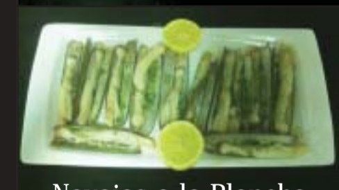
Navajas a la Plancha