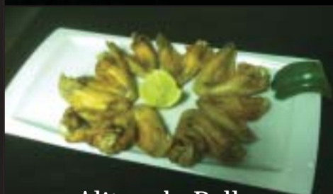
Alitas de Pollo