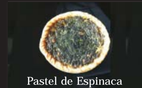
Pastel de Espinaca