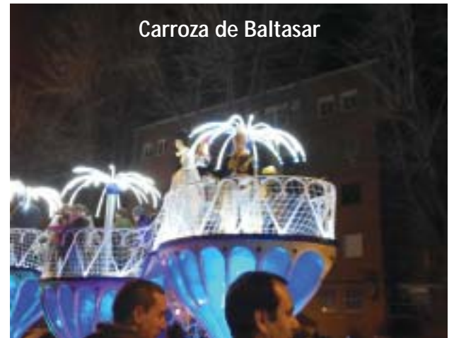
Carroza de Baltasar