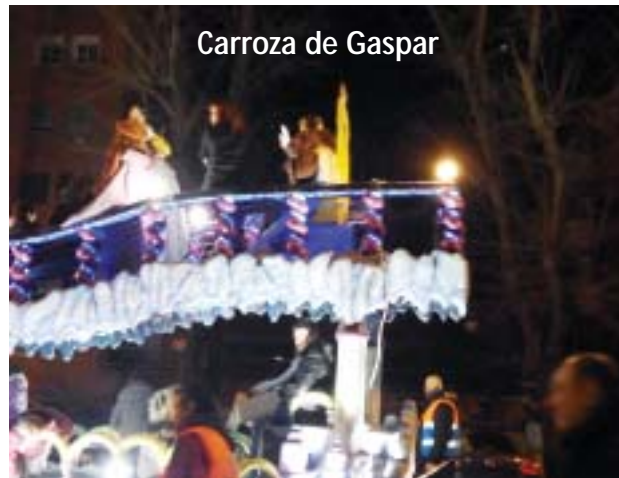
Carroza de Gaspar