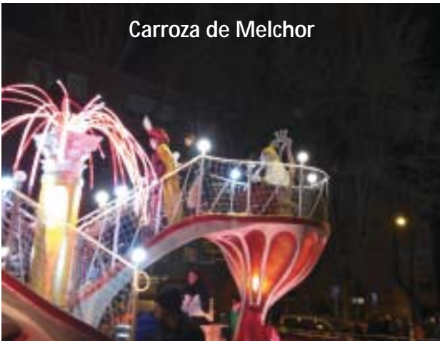
Carroza de Melchor

El pasado domingo 4 de enero los Reyes Magos de Oriente, junto a sus carrozas, recorrieron las calles del distrito de Moratalaz repartiendo caramelos e ilusiones a los pequeños en lo que sería el prelude antes del ansiado Día de Reyes.