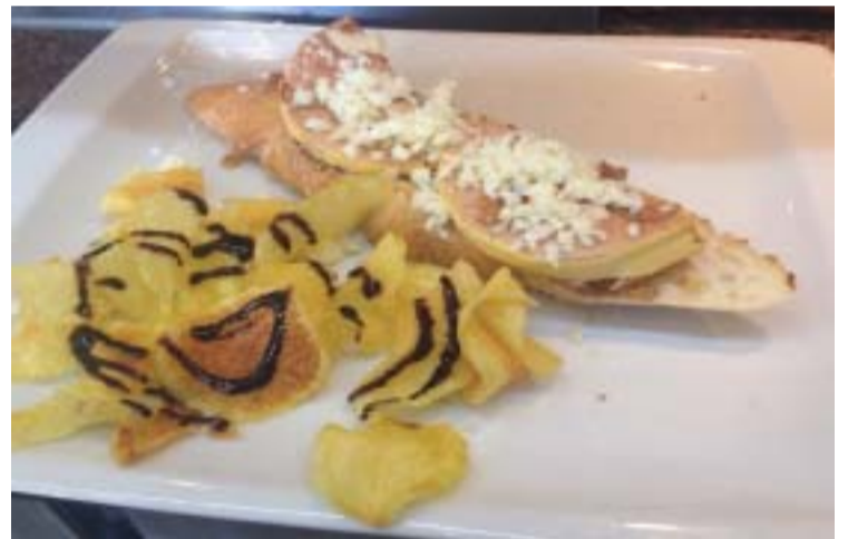
TAPA DE LA PERLA Mermelada de higo al oporto, con Fua de pato y queso manchego

mejor sabor de boca deje. De esta forma la Asociación de Comerciantes y Empresarios de Moratalaz, agrupación comercial que aglutina a buena parte de los comercios del distrito, y que organiza el evento, sitúa la fecha en la agenda de las Fiestas de Moratalaz para disfrute de los vecinos, con la intención de que, edición tras edición, la calidad de la Ruta y de las tapas de sus participantes no deje a nadie sin probar bocado. Frutas, verduras, hortalizas, carnes, pescados, dulces, vinagretas, especias... cada tapa tenía el reto de convertirse en un mundo y demostrar que de entre las 11 cuidadosamente seleccionadas por la Asociación, una tenía que sobresalir por encima del resto.