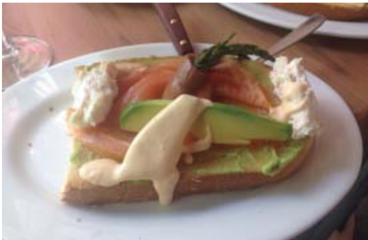
TAPA DE DON JOSÉ II Crema de aguacate con salmón y espárragos trigueros

Cuatro días fueron los elegidos para llevar la tapa a su máxima expresión en Moratalaz, del 11 al 14 de Junio. Una mezcla de sabores, texturas y colores que rivalizaban unos con otros hasta convertir una simple tapa