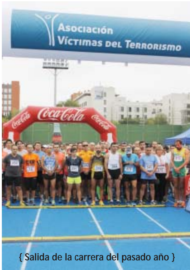
{ Salida de la carrera del pasado año }

En esta ocasión, la carrera se celebrará el domingo 27 de septiembre, a las 09:00 horas. La salida y la meta estarán situadas en la pista de atletismo del Polideportivo de Moratalaz (Calle Valdebernardo S/N), zona también de asistencia a los corredores