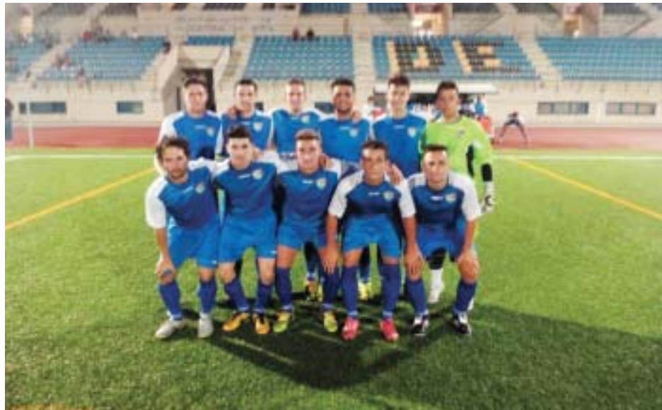
Aficionado A de la EDM

Otra novedad importantísima, que sin duda ayudara y mucho a la modernización de la entidad, es la implantación a partir de este año, de un aula de estudio con un profesor de apoyo, para todos aquellos alumnos que lo soliciten, una herramienta más para la formación de los chavales, sobre todo para aquellos que se desplazan desde lejos, o para aquellos que el horario de entrenamiento les parte la tarde haciendo muy difícil conciliar deporte con estudios. Esta actividad estará supervisada por un coordinador de estudios, que será el encargado de asignar a los alumnos uno u otro profesor, según el nivel de estudio que curse el jugador.