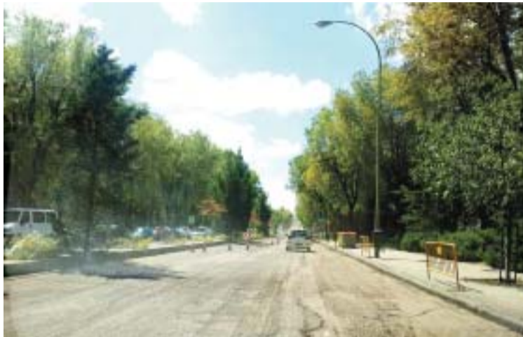
C/ Fuente Carrantona (antes)

Durante el pasado verano, así como en el mes de Septiembre, se ha podido ver cómo algunas calles de nuestro distrito al acabar el día presentaban un aspecto y a la mañana siguiente otro diferente, ¿el motivo? - "Renovar la cara de Moratalaz".