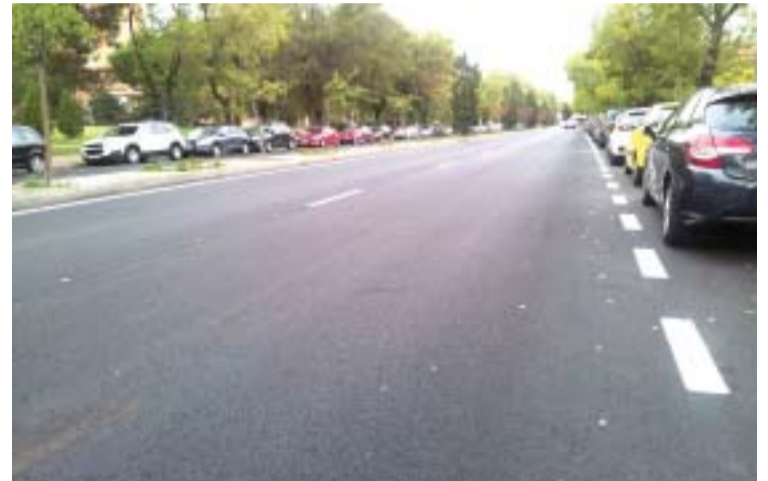
C/ Fuente Carrantona (después)

nes 328 ( ejecución rampas, reforma aseos, etc).