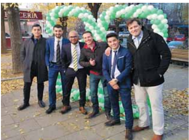
El Equipo de Tenfocasa, celebrando con entusiasmo, el 20 Aniversario, junto a su sede en Moratalaz.

Solo podemos decir: GRACIAS por su confianza, pero sobre todo por su preferencia todos estos años. Reiteramos nuestro compromiso de continuar siendo "la Inmobiliaria del barrio" muchos años más.