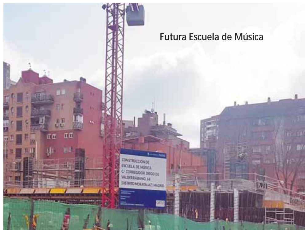
Futura Escuela de Música

Junto a estos nuevos espacios, también ha abierto sus puertas recientemente la renovada piscina cubierta del CDM Moratalaz y, dentro de unos meses, lo hará el campo de béisbol del CDM La Elipa, tras unas obras que han consistido en su adaptación a las dimensiones reglamentarias, la modernización de los vestuarios o la construcción de un túnel de bateo cubierto para prácticas.